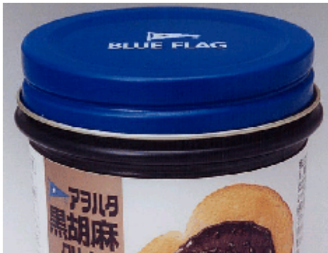
＜旧キャップ(スクリューキャップ)＞