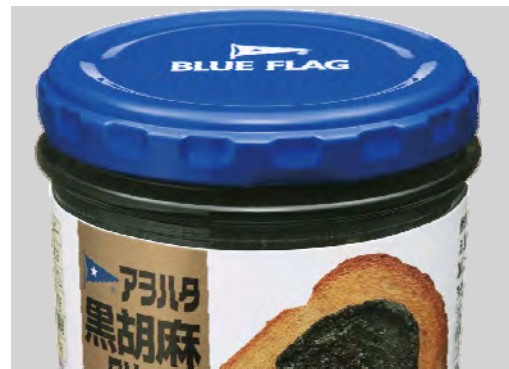
＜新キャップ(ツイストキャップ)＞