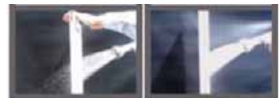
< 通常の網戸 >

花粉やホコリによる網目の目詰まりはほとんどなく、付着した花粉やホコリは軽く叩くだけでほとんど落ちます。また、急な雨でも雨水が室内に降り込みにくいので、あわてて窓を閉める必要がありません。