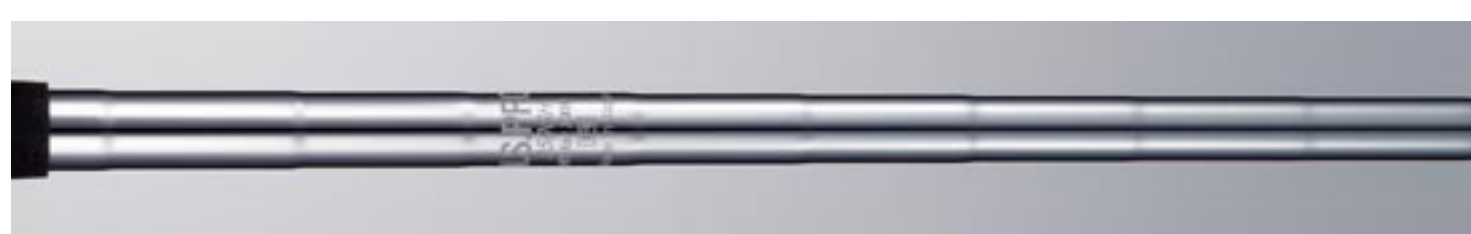
NS PRO 950GH HT for XXIO

しっかりとしたスイングで打ち込みたいプレーヤー向けにスチールシャフトもラインアップしています。日本シャフト(株)と共同開発した「NS PRO 950GH HT for XXIO」は、「ザ・ゼクシオ」のために開発された専用設計で、ロング~ミドルアイアンでも高弾道の球筋を実現します。