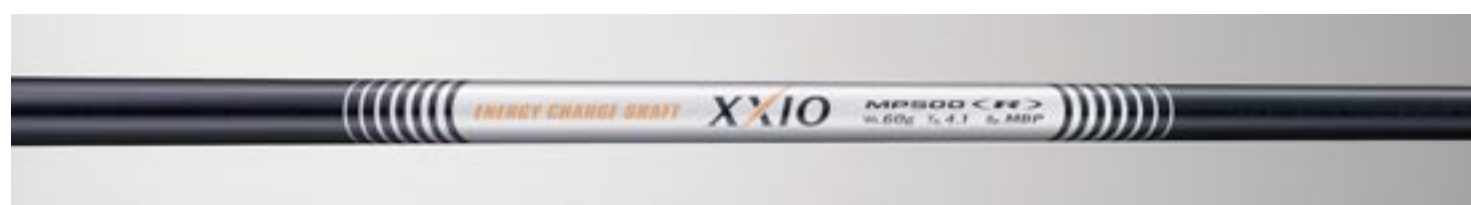
MP500カーボンシャフト

エネルギーチャージシャフトでヘッドスピードアップ スイング時におけるシャフトの断面を解析すると、最も力のかかる手元部分が楕円形に変形しており、この部分のシャフト断面剛性を高くすることでヘッドスピードが上がることをデジタルシミュレーションIIIによって解明しました。新開発シャフト「MP500」では、このシャフトの手元部分のフープ層(シャフトに対して垂直に配置されたカーボン層)に、70tの高弾性素材を積層することにより断面剛性を向上させました。