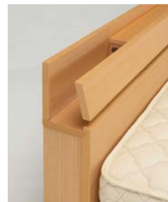
ヘッドボード (キャビネットタイプ)

飽きのこないシンプルで機能的なデザインのキャビネットタイプのデザイン2種、フラットタイプのデザイン2種をご用意しました。