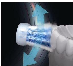
「ワイドスウィング」

みがく場所やお好みに合わせ、スウィングモードスイッチでそれぞれを選択することができます。