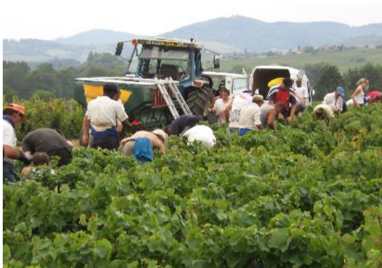
▲高価格ワインと同様に手摘みでの収穫