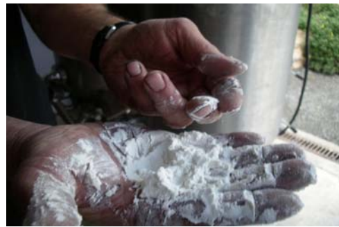
▲パウダー状の貝殻

醸造用フィルター代わりに、パウダー状にした貝殻を使い澱（おり）を取り除く「キーゼルギュール」というろ過方法を使用。このろ過方法は、化学的・機械的でない単純な方式のため、ワインに与える影響を少なくして自然な状態を保つことができます。また、ろ過に時間が掛かるため、通常は高価格ワインに多く使われます。