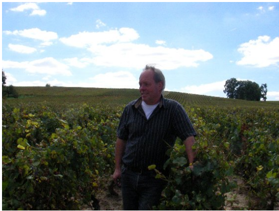
▲ 造り手：チェリ・カナー氏

1 1 代目のカナー氏が、葡萄造りから醸造、ボトリング迄一貫して行っております。