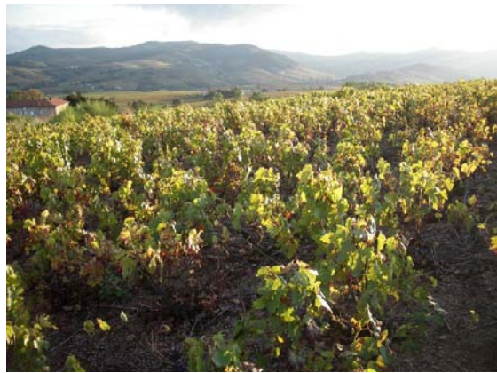
▲高品質な葡萄が取れることで有名な