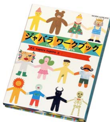
「ジャバラワークブック」 表紙

ジャバラになった1ページ、1ページにいろいろな形のいきものが描かれています。いずれも顔や服など足りない箇所があるので、付属のシール(6枚)や色紙(10枚)を貼ったり、色鉛筆(※色鉛筆は付属していません)で描き加えたりすることで、自分だけの絵本を作成できます。