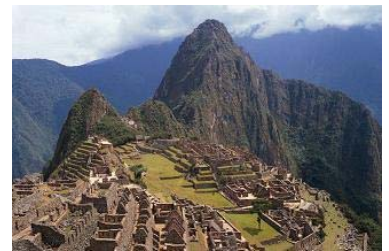
マチュピチュ遺跡