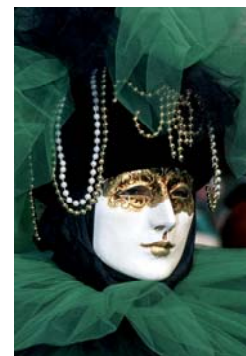
カーニバルの仮面 (イメージ)