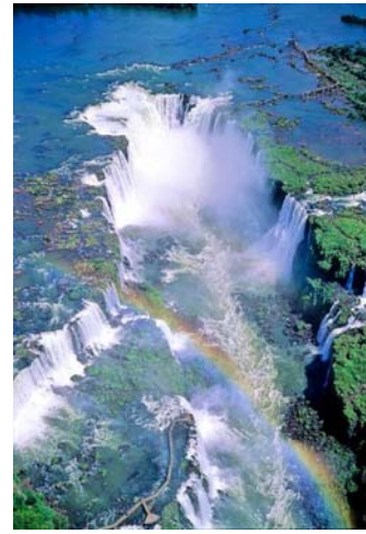
世界最大の滝イグアス大瀑布