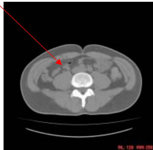
摂取 8 週間後