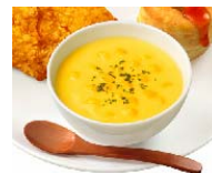
「十勝産コーン入りポタージュ」 ※写真はイメージです。

十勝産のコーンがたっぷり入った、寒くなるこの時期にぴったりの、あったかポタージュです。