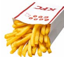
「フリフリポテト」 ※写真はイメージです。

KFC オリジナルのスパイスを振りかけて食べる「フリフリポテト」のスパイスに北海道産バターを使用した「じゃがバター味」に加え、この秋、新たに「スパイシーペッパー味」、「焼きとうもろこし味」、「金ごま唐辛子味」の 3 種のスパイスが新登場。4 種からお好きなスパイスをお選びいただけます。