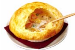
「チキンポットパイ」 ※写真はイメージです。

サクサクのパイを割ると、チキンと野菜がたっぷり。寒さに向かうこの時期にぴったりのボリューム満点のあつあつシチューです。