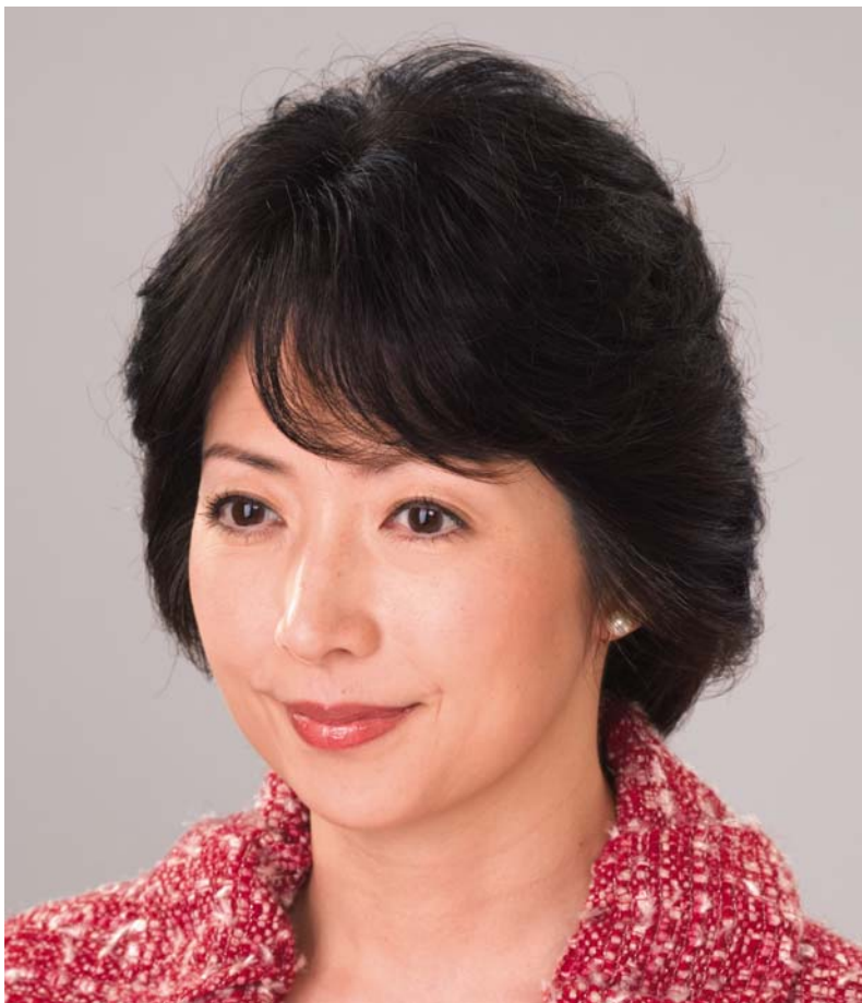
ナチュラルピース (Sサイズ) ¥25,000 (税込¥26,250) ※モデル画像の転用不可