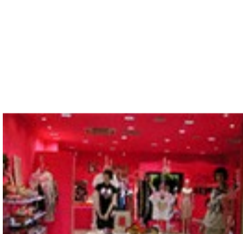
「キラキラジャパンプロジェクト」