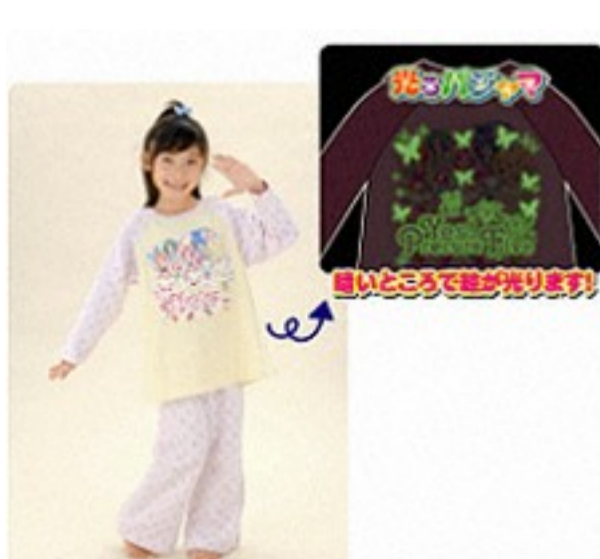
Yes!プリキュア5 ©ABC・東映アニメーション