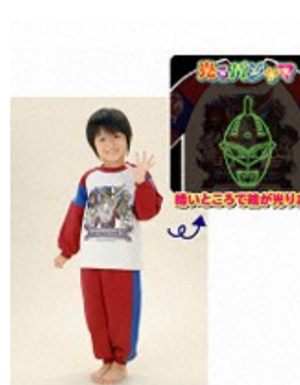
大怪獣バトルULTRA MONSTERS ©2007円谷プロ ©BANDAI2007