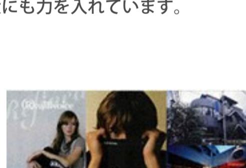
「Real B voice」

また、2000年以降は、「Real B voice(リアルビーボイス)」「00～」、「mi・ke・ra」シリーズ【01～】、「キラキラジャパンプロジェクト」【05～】、「Sweet Razzor(スイートラザー)」「07～」など、ジュニア・メンズ&レディース市場へ向けて、オリジナルブランドを立ち上げており、新規顧客の拡大にも力を入れています。