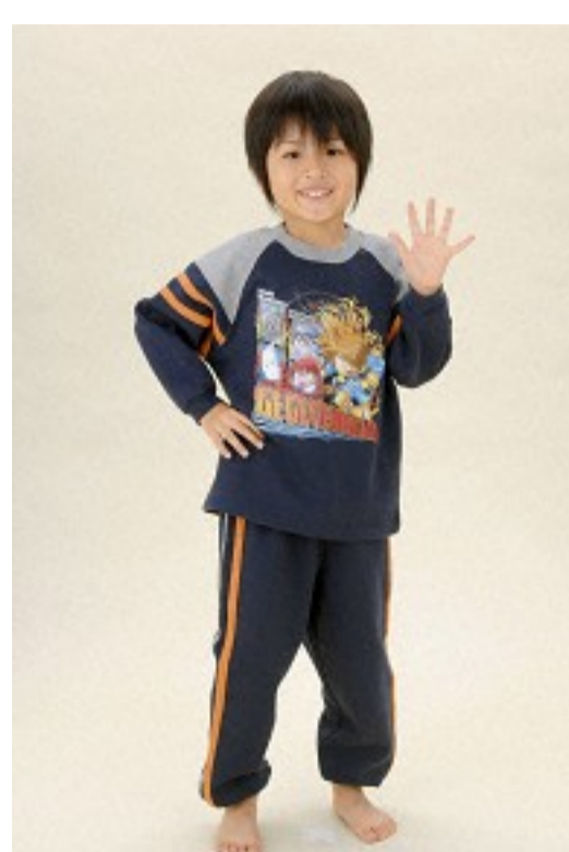
ゲゲゲの鬼太郎 ©水木プロ・フジテレビ・東映アニメーション