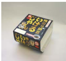
関東・東北・北海道エリア版