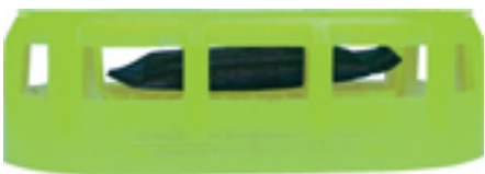
鮮度保持剤入りキャップ

備長炭+活性炭の炭パワーで野菜室の気になるニオイを強力に脱臭するのはもちろんのこと、さらに粒状パラジウム活性炭の〔鮮度保持剤〕を黄緑色のキャップ部分に新採用しました。これによって野菜を痛める要因であるエチレンガスもしっかりと吸着します。