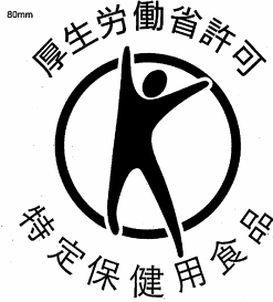
特定保健用食品許可マーク