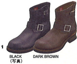
1 BLACK DARK BROWN (写真)