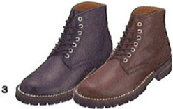
3 BLACK DARK BROWN