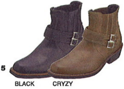
5 BLACK GRZY