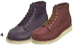
4 BLACK RED BROWN