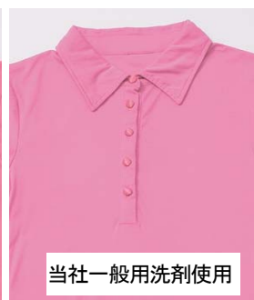
当社一般用洗剤使用