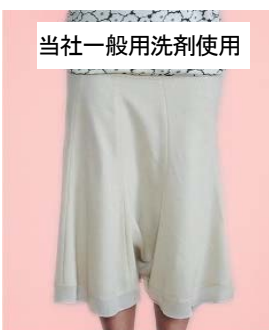
当社一般用洗剤使用