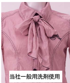
当社一般用洗剤使用