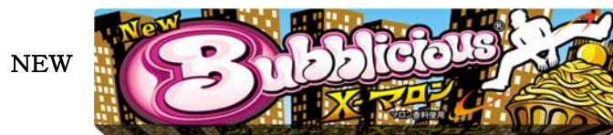
バブリシャス X-マロン