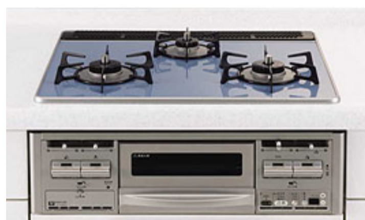
(フェアリーブルー)