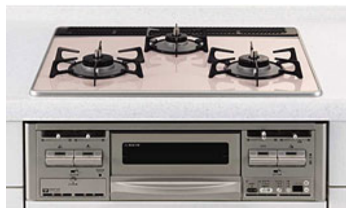
(フェアリーピンク)