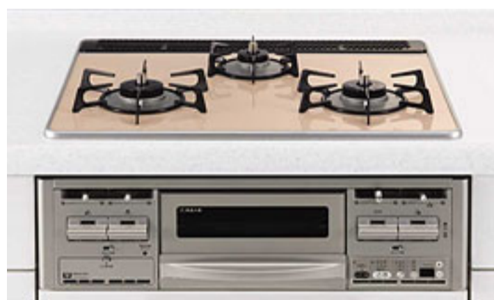
(フェアリーオレンジ)