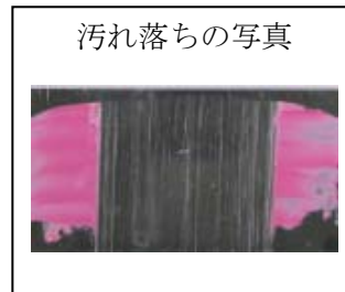
<ソフトタイプの不織布面の洗浄力テスト> ステンレス板に口紅をつけて 洗剤をつけずにこすったもの 住友スリーエムのテストによる