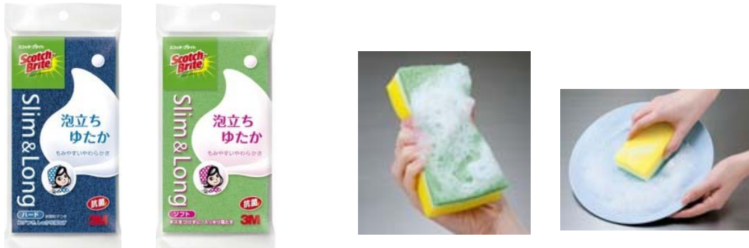
(左から) <スコッチ・ブライト>泡立ちゆたかスポンジ ハードタイプ、ソフトタイプと使用例