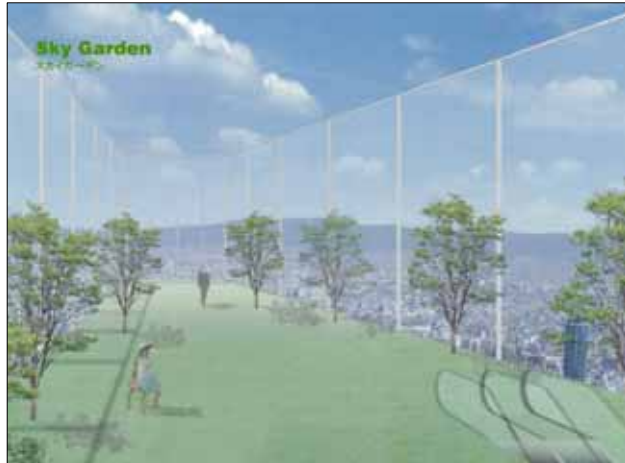
スカイガーデン イメージパース

ビルの最上階には、大阪平野を一望できる展望台を設置します。カフェやみやげ物などを扱うショップ等も設け、南大阪エリアの新しい観光スポットを形成します。さらに屋上部分をスカイガーデンとし、約300mの高さを屋外で体感する非日常空間を演出します。 延床面積・・・約1,600㎡