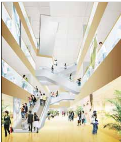
百貨店 吹抜け部分 イメージパース

延床面積・・・約84,000㎡(タワー館のみ)(既存部分と合わせて約169,000㎡)