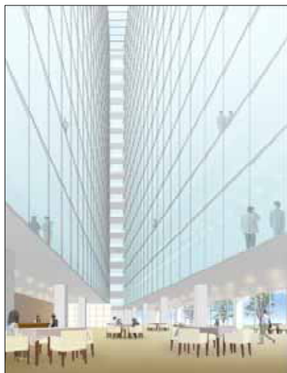
ホテル・レストラン イメージパース