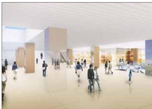
地下鉄との接続 地下1階エントランス イメージパース

地域の回遊性の向上を目指し、公共的空間の提供をはじめとした様々な施策を実施してまいります。 タワー館(仮称)の地下1階においては、地下鉄・JRとの結節点として敷地北西部の地下接続部で約800㎡の歩行者空間やバリアフリーエレベーターを設けるとともに、2階部分においては、現在デザインコンペが行なわれ付替えが予定されている阿倍野歩道橋と接続することを生かし、ビルの北側、西側、南側に歩行者デッキを設置するとともに、ビル内に南北に約1,000㎡の公共的屋内空間を設けます。イベントスペース、待ち合わせ空間として整備することで、地下鉄やJRからビルを介して南の常盤地区まで安全で快適な歩行者ネットワークを形成します。