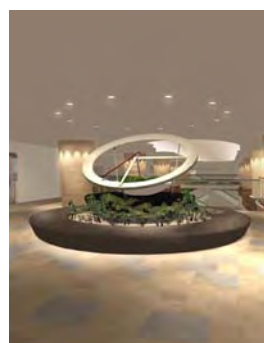
<5階E L Vホール花時計（イメージ）>