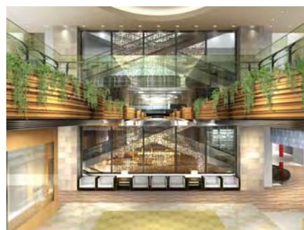
<「風の森」というテーマを表現する木の曲線ラインと植栽が吹き抜けのアウトラインの演出>