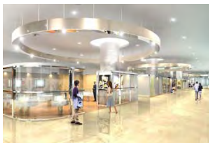
<1階大きな4つのリングが特徴的な統一天井>