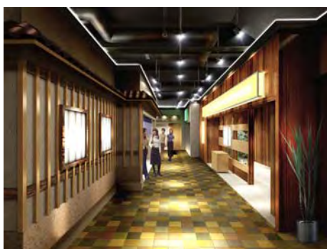
<5階レストラン小径ゾーン>

5階に位置するレストランゾーンでは、浦和の街に高いグレード感を持った食の空間を提供いたします。個店ごとの個性と風格を纏ったファサードが軒を連ねる吹き抜け側のダイニングゾーンと、食のもつライブ感や界隈性が感じられる小径ゾーンで構成されています。季節感を創出する植栽計画とともに、待ち合わせ機能としてのエレベーターホールの花時計も設置致します。