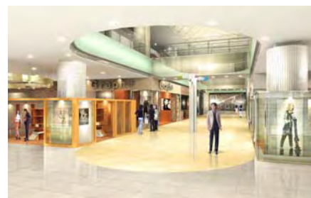
<『光の谷』のテーマである1階T字型の吹き抜け空間>