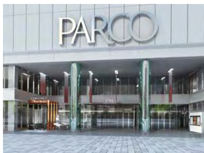
<浦和駅側メインエントランス>

1階浦和駅側のメインエントランスでは、印象的な光のゲートがお客様をお迎えいたします。ビルの内部へと足を踏み入れると、大きな4つのリングと特徴的な統一天井ゾーンが施設導入部を演出し、お客様をビルのさらに奥へと誘います。1～2階に渡って広がる T 字型の吹き抜け空間では、『光の谷』という環境テーマに基づき、間接照明の柔らかな光で吹き抜け空間を演出します。