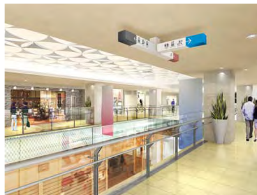
<吹き抜け上部に施された曲線のレリーフ>