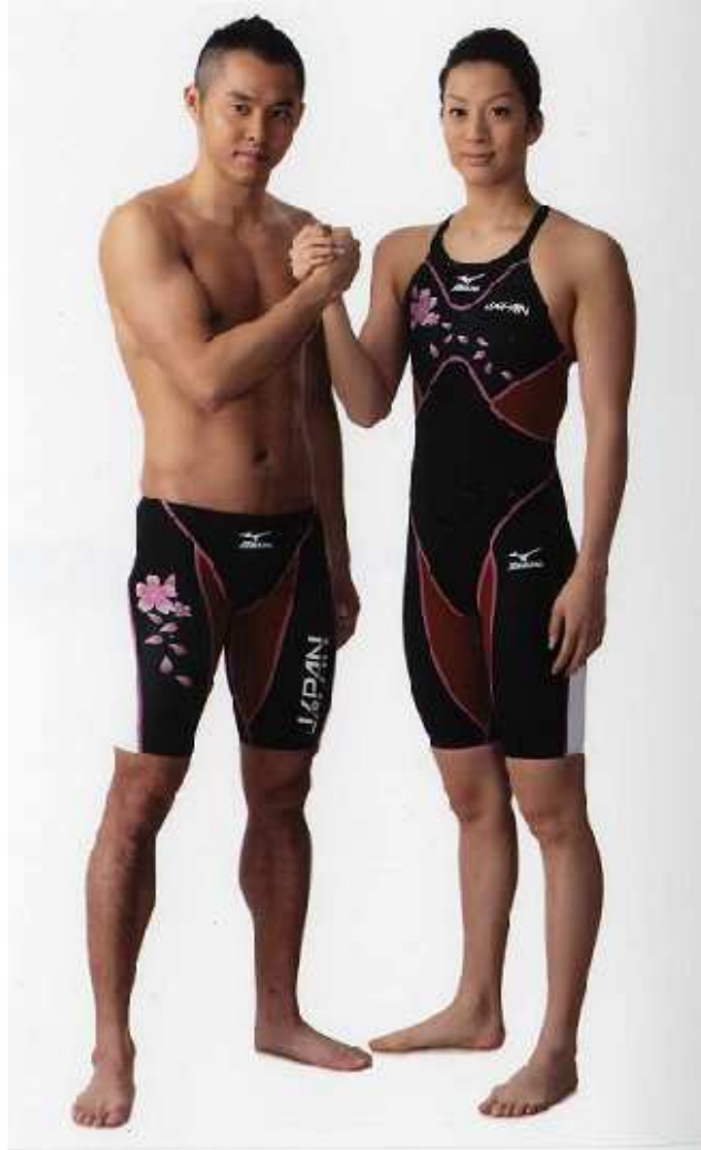
「世界競泳2007 イン ジャパン」日本代表レプリカ水着

(左：ハーフスパッツ¥11,000 右：ハーフスーツ¥16,500) ※税別価格