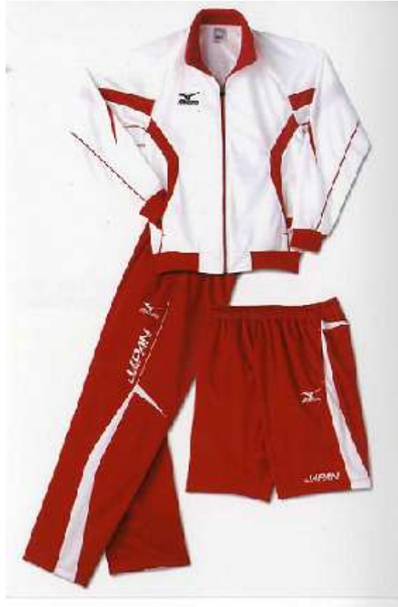
世界競泳2007 イン ジャパン 日本代表レプリカウォームアップ・ハーフパンツ 記