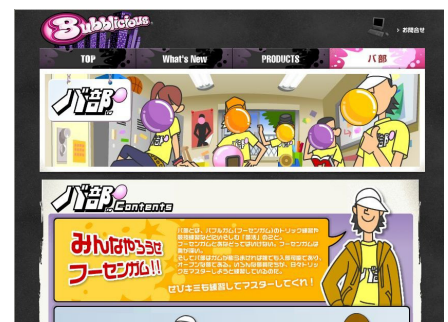
「バ部」トップページ