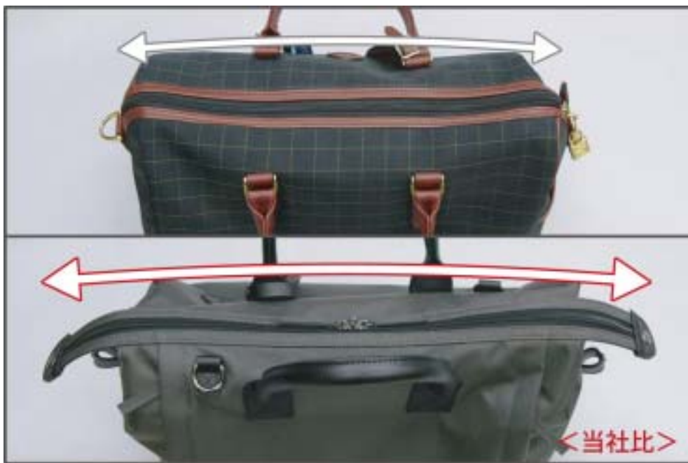
開口部の比較（当社比）

1989年にフランスで誕生。以来、日本の誇るハイテク素材にランドセルづくりで長年培ってきた繊細な技術と加工を用い、さらには日本の伝統美に HIDEO WAKAMATSU ならではの現代的なデザイン感性を吹き込み、作りあげております。1989年フランスのブティックを皮切りに各地に販売網を広げ、イギリスのセルフリッジやアメリカのフライト001などで展開。2005年には自由が丘店に国内初の HIDEO WAKAMATSU ショップをオープンしました。