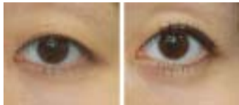
参考写真 1: アイライナーとマスカラのメイク効果 (左:使用前、右:使用後)