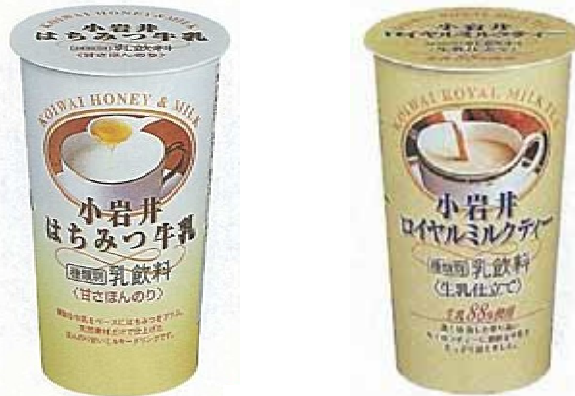
1996 年発売の「小岩井 はちみつ牛乳」と「小岩井 ロイヤルミルクティー」

1996 年発売当時には、「パーソナルカップ飲料」という呼称で発売し、個々人に手軽に「乳」のおいしさを味わってもらうというコンセプトの飲料でした。2001 年からプラカップを採用し、現在までに様々なカップ飲料を発売しております。今春発売した「小岩井 生乳シリーズ」は、当時のコンセプトそのままに「乳」の せいじゅう コクを楽しめるカップ飲料となっています。