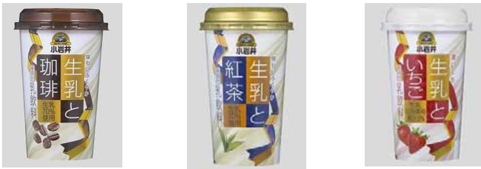
「小岩井 生乳シリーズ」の、「小岩井 生乳と珈琲」、「小岩井 生乳と紅茶」、「小岩井 生乳といちご」

1996 年発売当時には、「パーソナルカップ飲料」という呼称で発売し、個々人に手軽に「乳」のおいしさを味わってもらうというコンセプトの飲料でした。2001 年からプラカップを採用し、現在までに様々なカップ飲料を発売しております。今春発売した「小岩井 生乳シリーズ」は、当時のコンセプトそのままに「乳」の せいじゅう コクを楽しめるカップ飲料となっています。