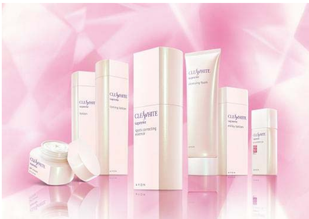
「クリアホワイト シュプリーム」シリーズ(全7アイテム)

* 美白とは、メラニンの生成を抑えることで、日やけによるシミ・ソバカスを防ぐことです。