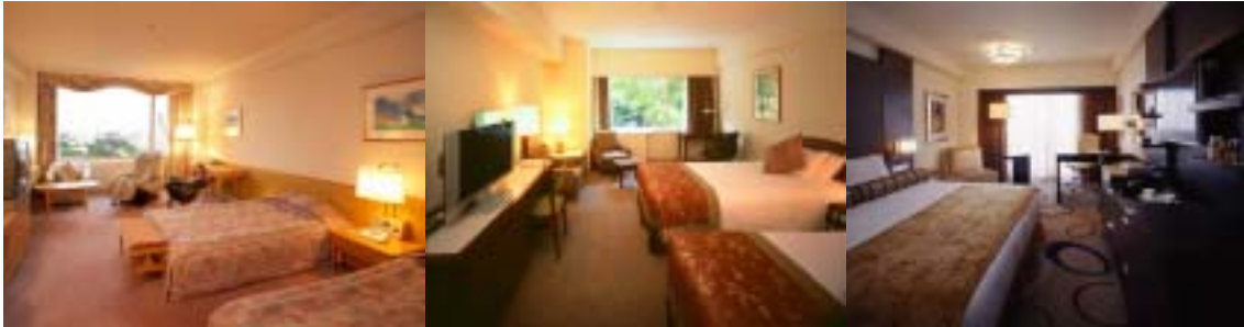
〔ザ・プリンス さくらタワー東京 客室〕