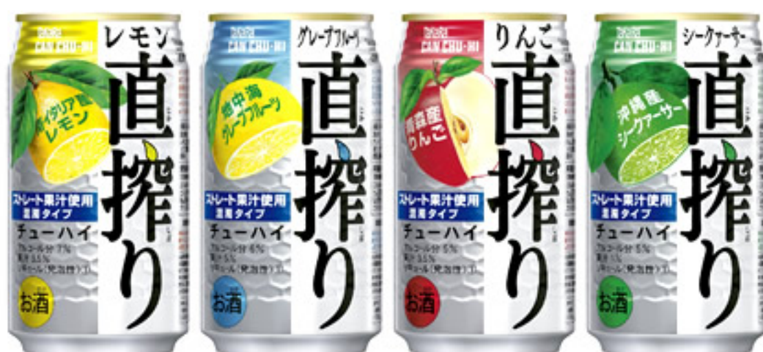
タカラCANチューハイ「直搾り」 (左より、<レモン>、<グレープフルーツ>、<りんご>、<シークァーサー>)