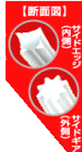
極細毛の断面図（イメージ）