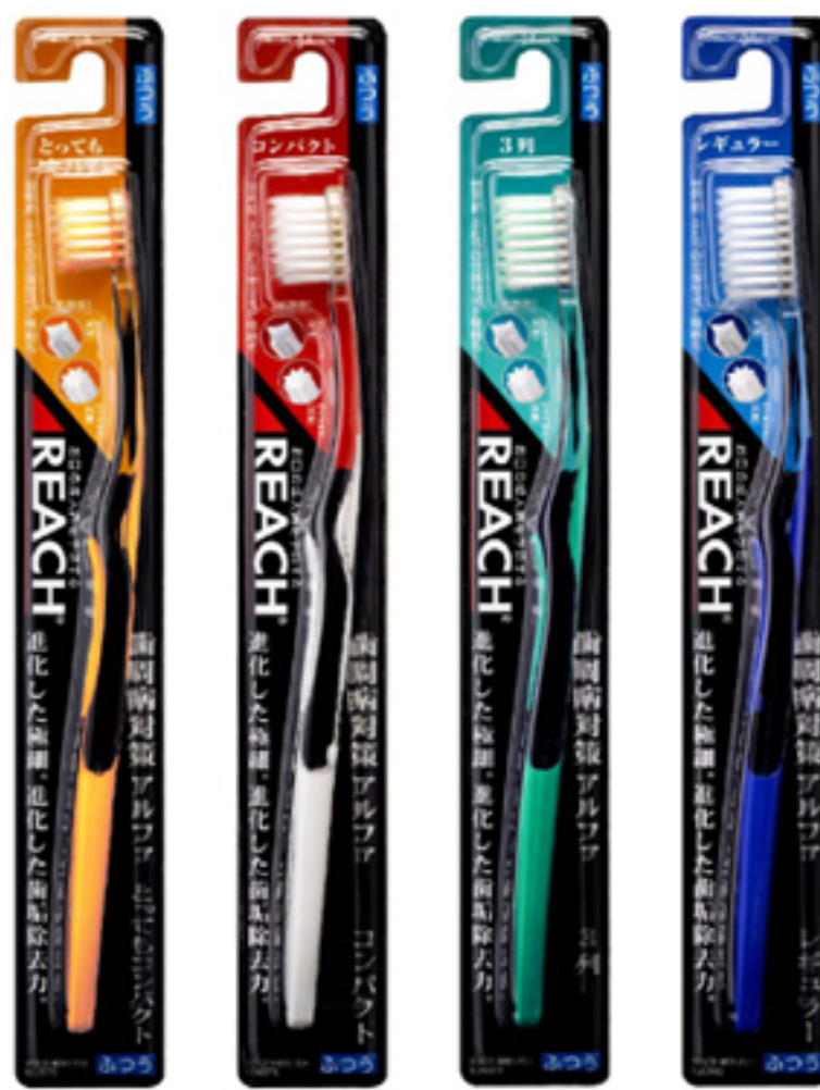
とってもコンパクト コンパクト 3列 レギュラー