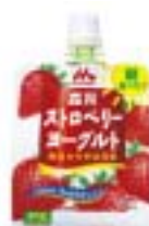
【ストロベリーヨーグルト ハンディスタイル】