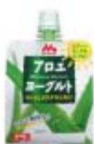
【アロエヨーグルト ハンディスタイル】

いずれも、時間のない朝食の代わりとして、またおやつとしても手軽にお召し上がりいただくと、10～30代の方を中心に人気を集めています。