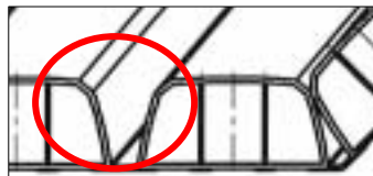
当社商品（平滑形状）