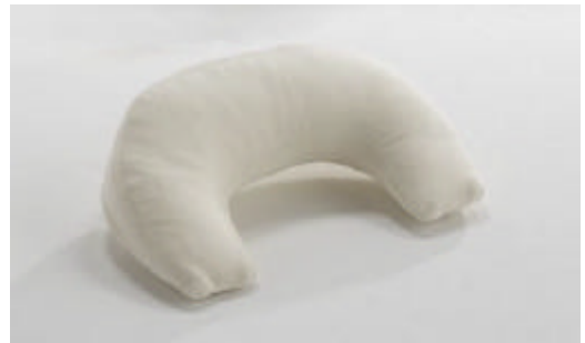
フェイスクッション