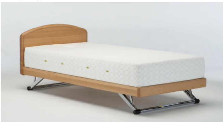
ベッドフレーム (DS-100) + マットレス (AY-ロイヤルファームマットレス)