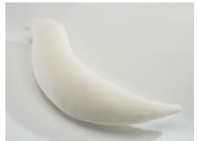
ボディピロー バード