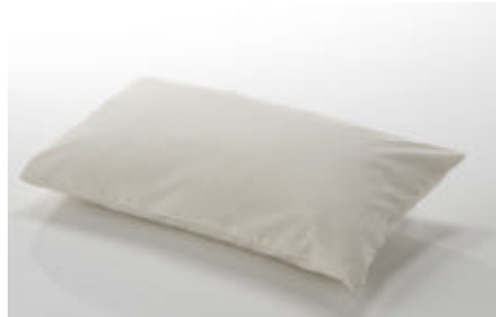
うつぶせサポートクッション/フェザー