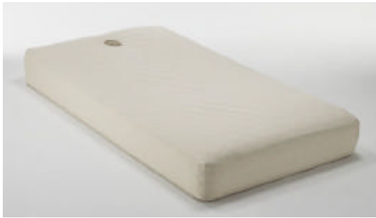
うつぶせ寝専用マットレスカバー