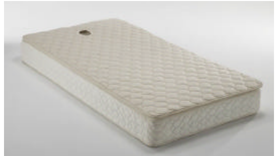
うつぶせ寝専用ベッドパッド